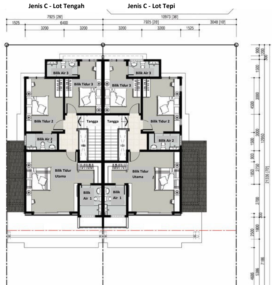
Pelan Tingkat Satu