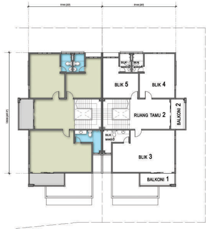
PELAN TINGKAT SATU