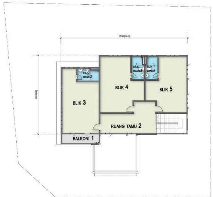
PELAN TINGKAT SATU