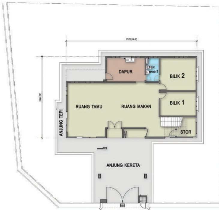
PELAN TINGKAT BAWAH