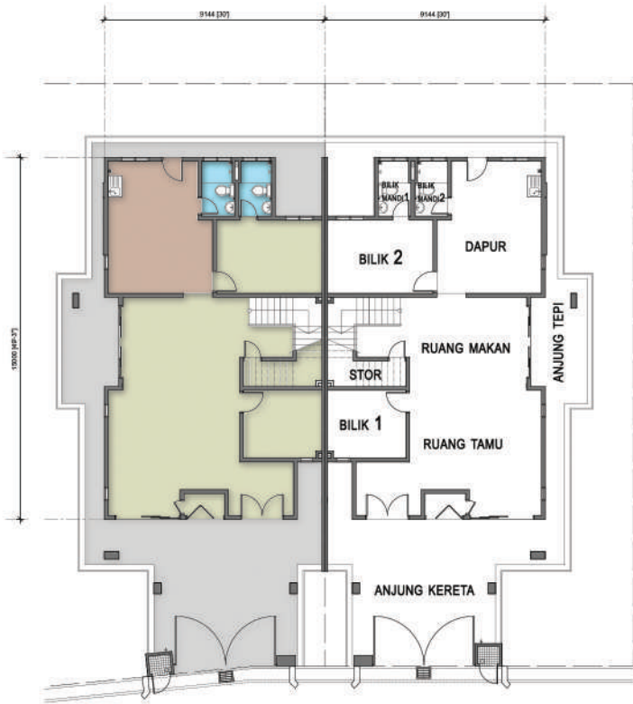
PELAN TINGKAT BAWAH