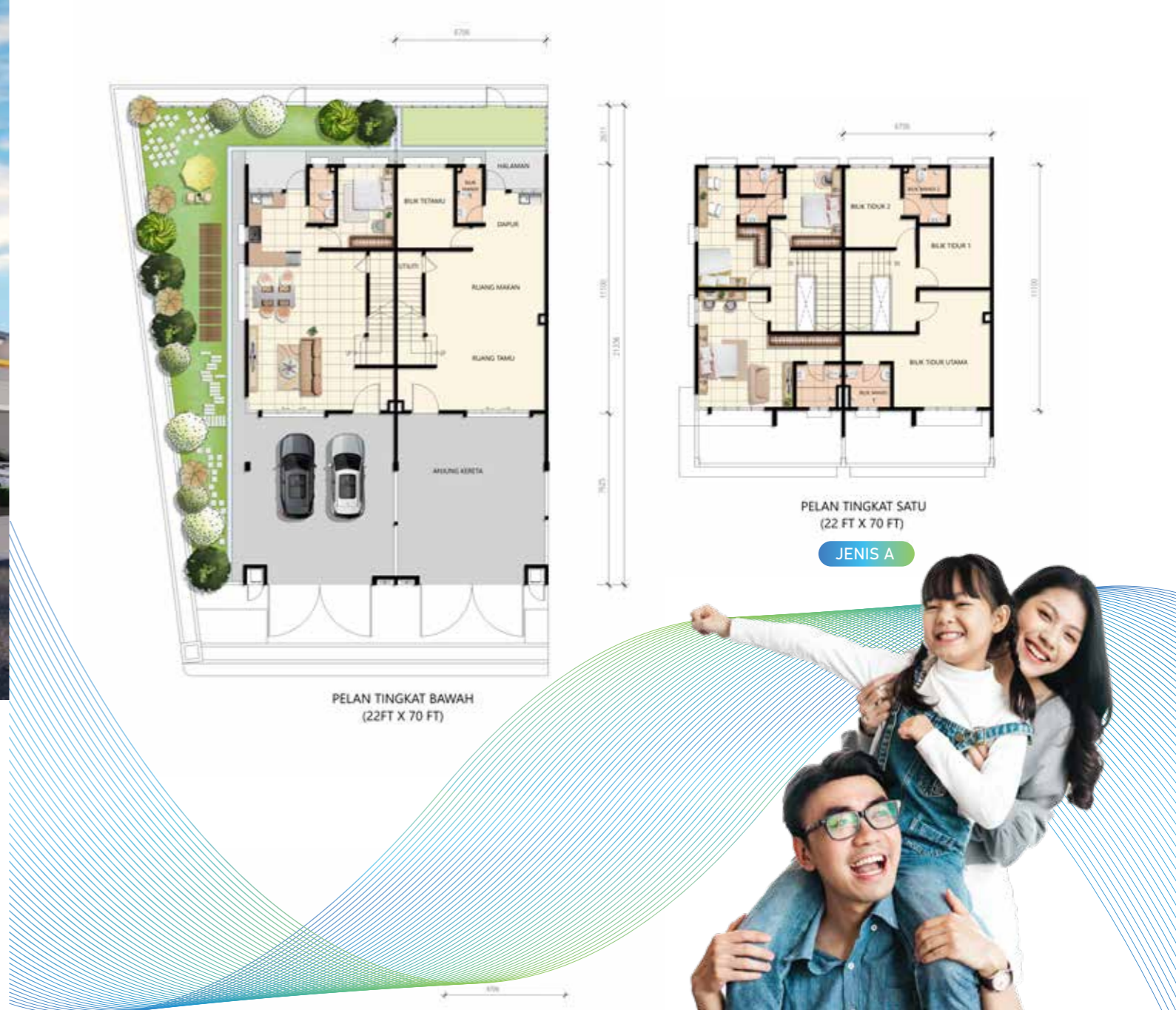
PELAN TINGKAT SATU (22 FT X 70 FT)