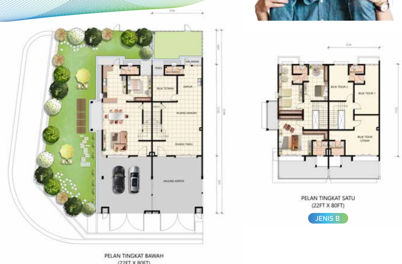
PELAN TINGKAT BAWAH (22 FT X 80 FT)