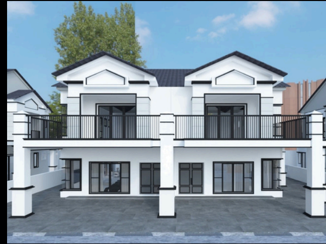
8 unit Rumah Berkembar 2 Tingkat (40'X75') Harga Minimum RM 838,000.00 Harga Maksimum RM 988,000.00

IKLAN INI TELAH DILULUSKAN OLEH JABATAN PERUMAHAN NEGARA