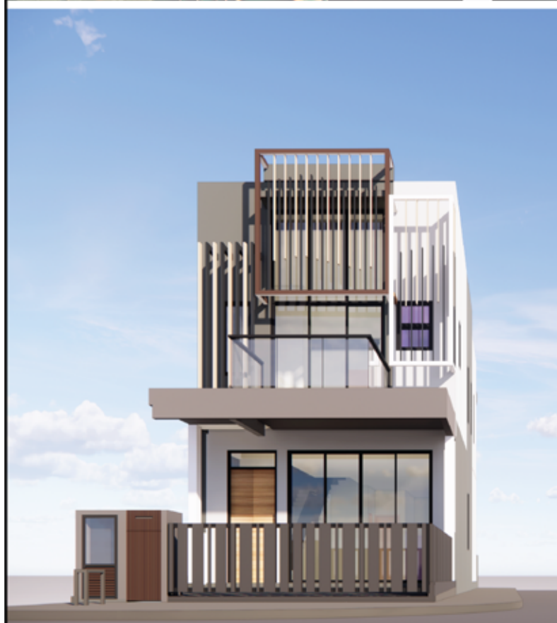
FASAD (PANDANGAN DEPAN)