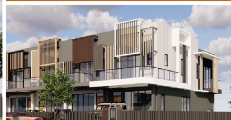
FASAD (PANDANGAN SISI)