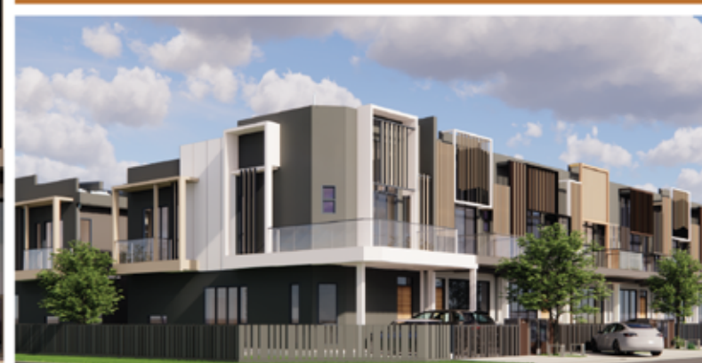
FASAD (PANDANGAN SISI)