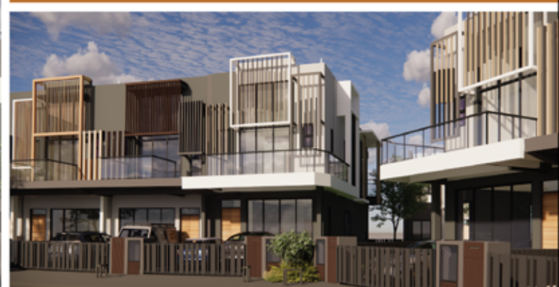
FASAD (PANDANGAN SISI)