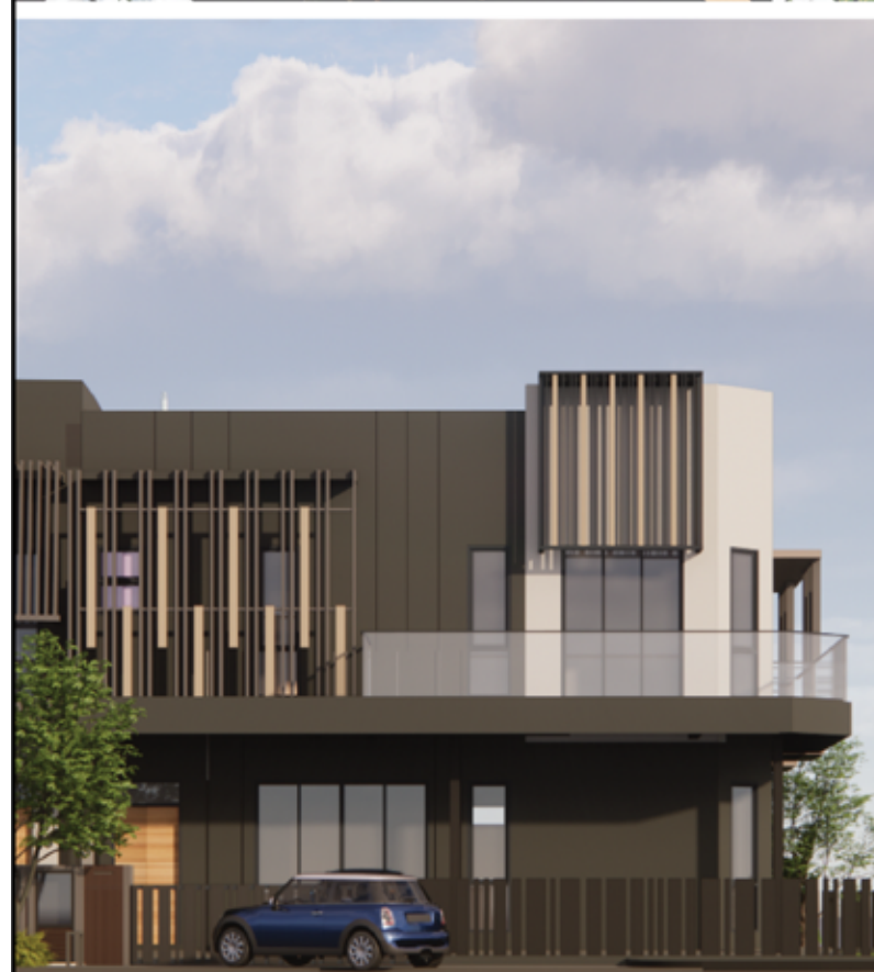
FASAD (PANDANGAN DEPAN)