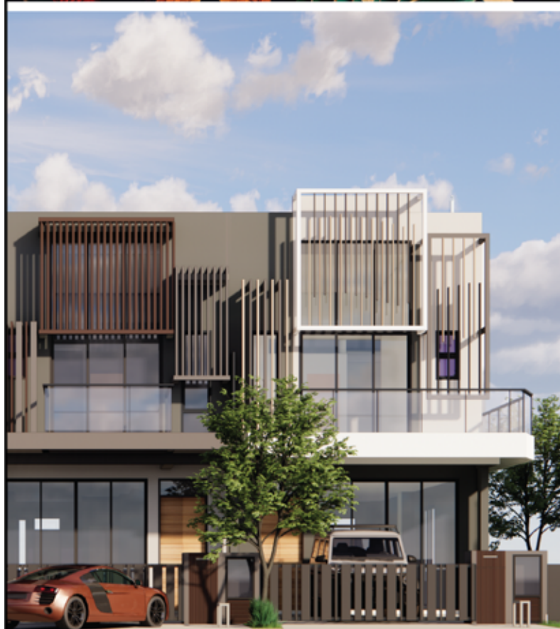
FASAD (PANDANGAN DEPAN)