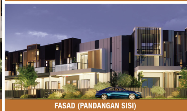
FASAD (PANDANGAN SISI)