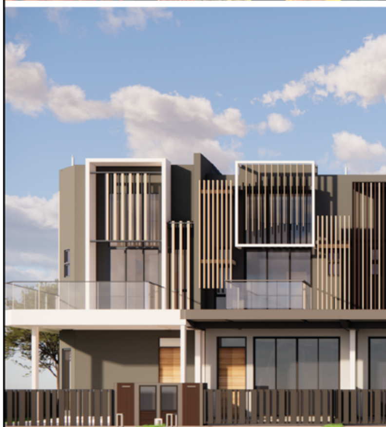
FASAD (PANDANGAN DEPAN)