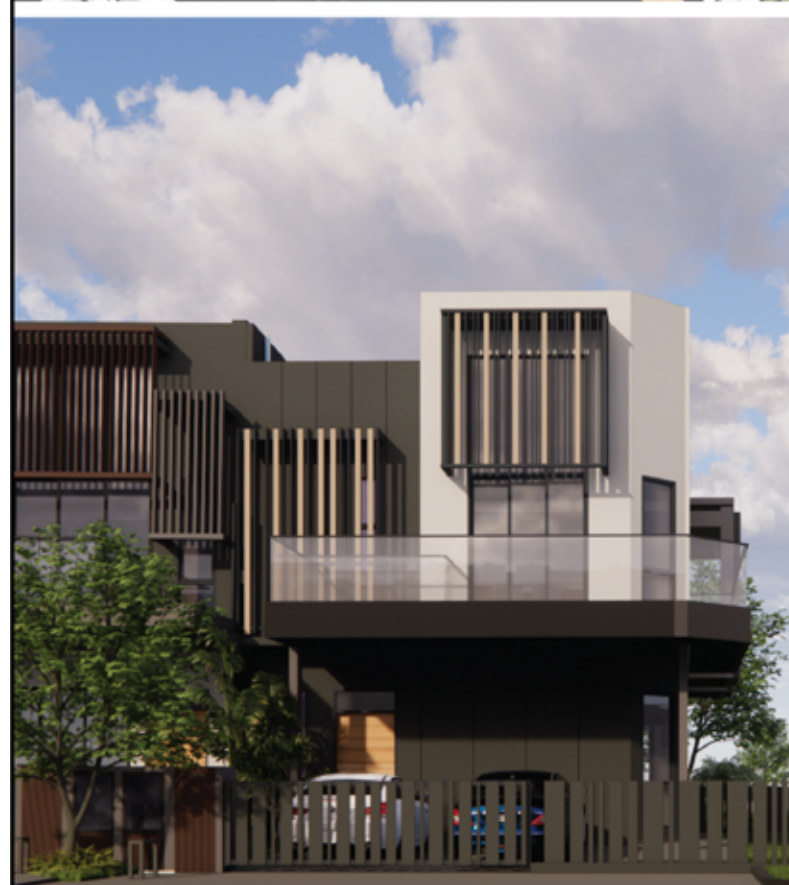
FASAD (PANDANGAN DEPAN)