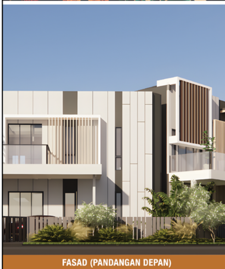
FASAD (PANDANGAN DEPAN)