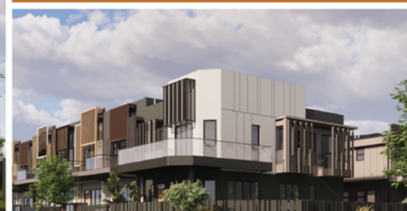
FASAD (PANDANGAN SISI)