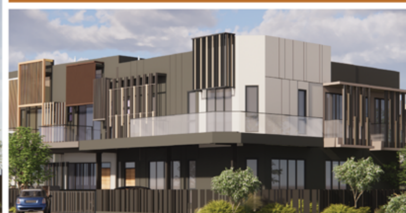
FASAD (PANDANGAN SISI)