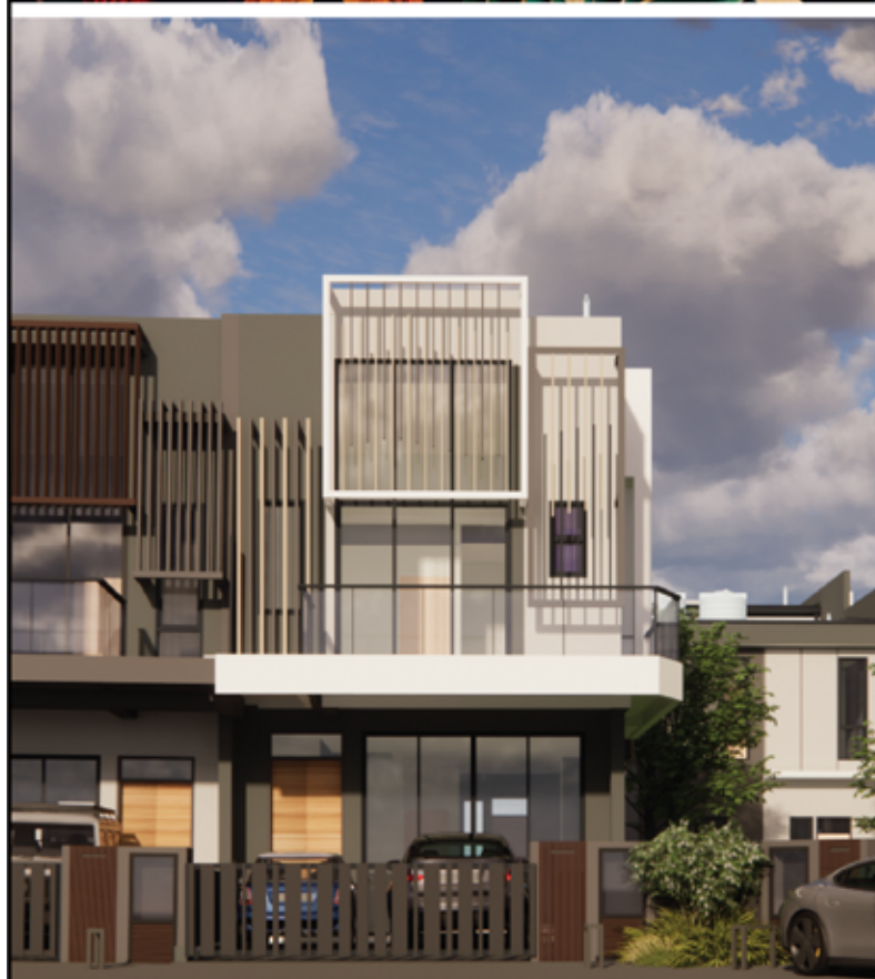
FASAD (PANDANGAN DEPAN)