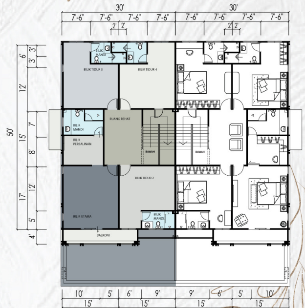
Pelan Tingkat Atas