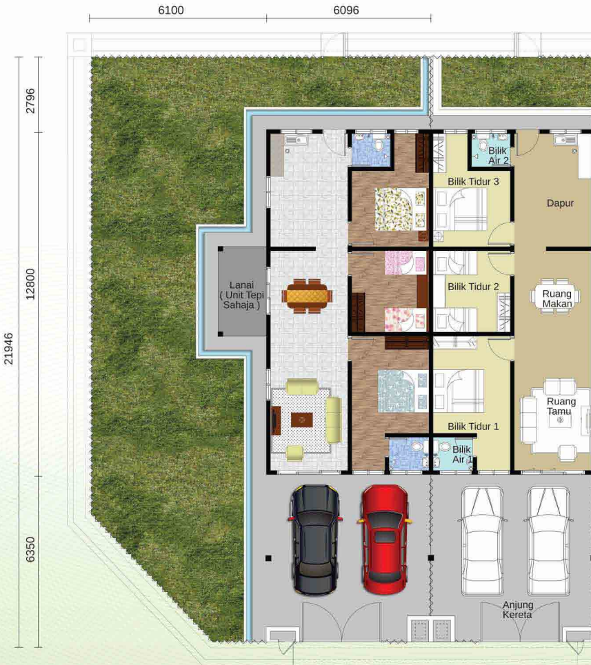
Rumah Teres Setingkat 20' x 72' 1,050 k.p.s