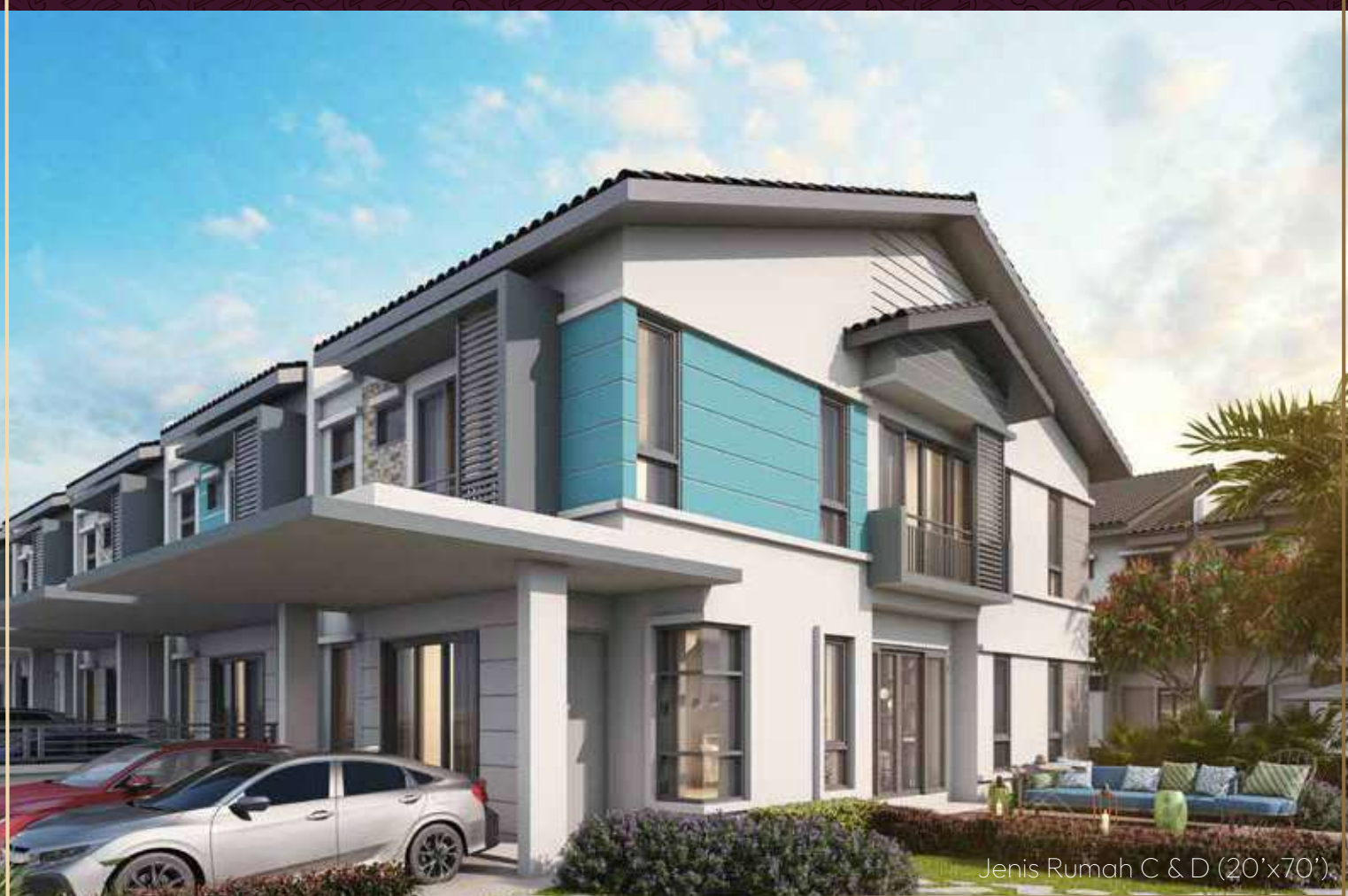
Jenis Rumah C & D (20'x70')