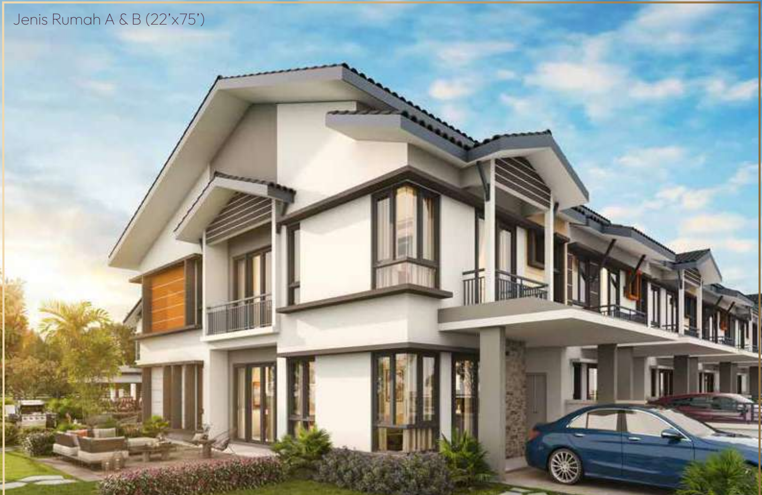
Jenis Rumah A & B (22'x75')