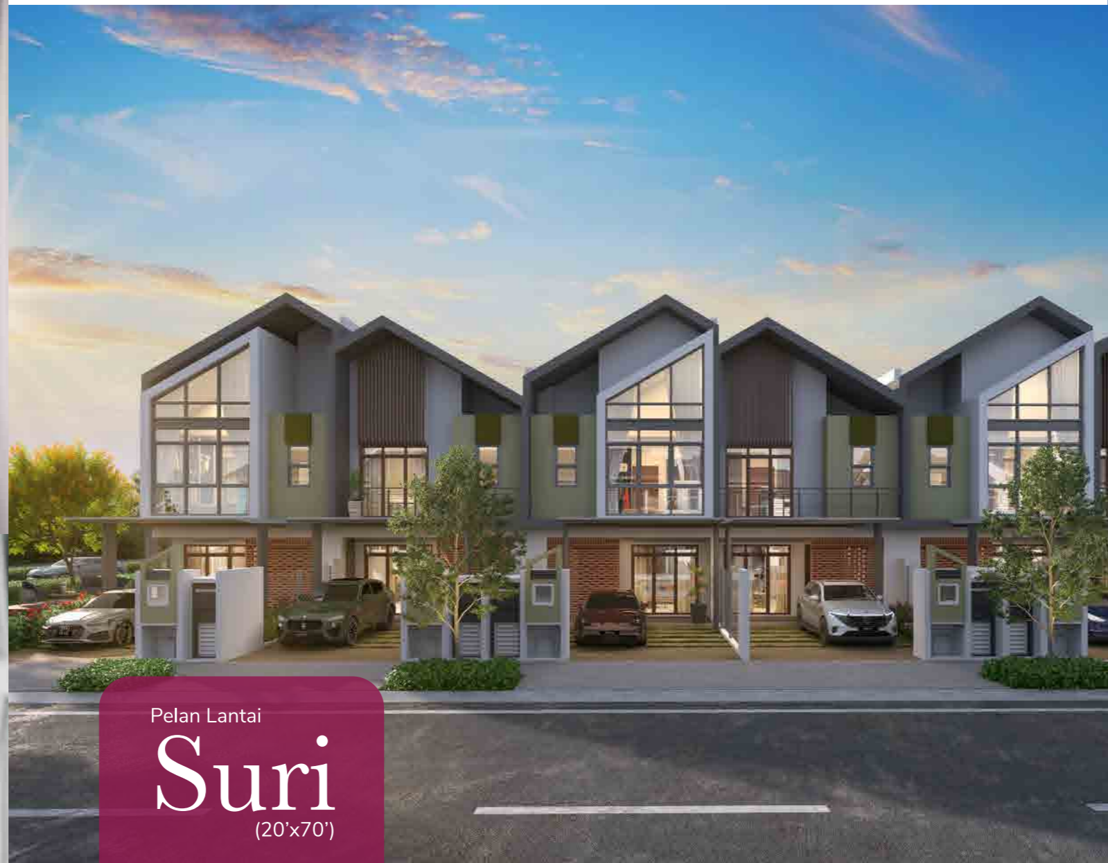
Pelan Lantai Suri (20'x70')