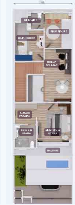
PELAN LANTAI TINGKAT ATAS