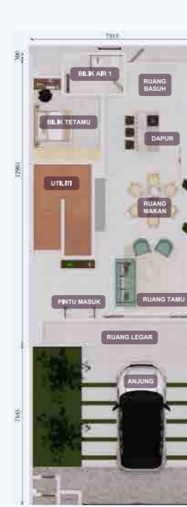
PELAN LANTAI TINGKAT BAWAH