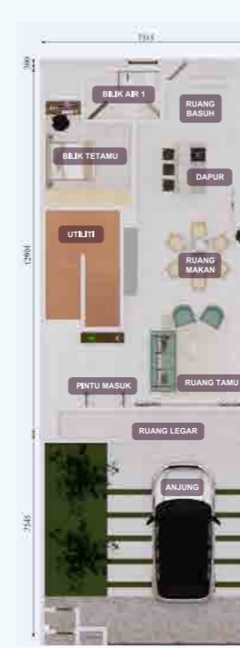
PELAN LANTAI TINGKAT BAWAH