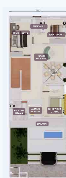
PELAN LANTAI TINGKAT ATAS