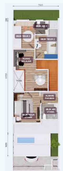
PELAN LANTAI TINGKAT ATAS