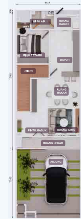
PELAN LANTAI TINGKAT BAWAH