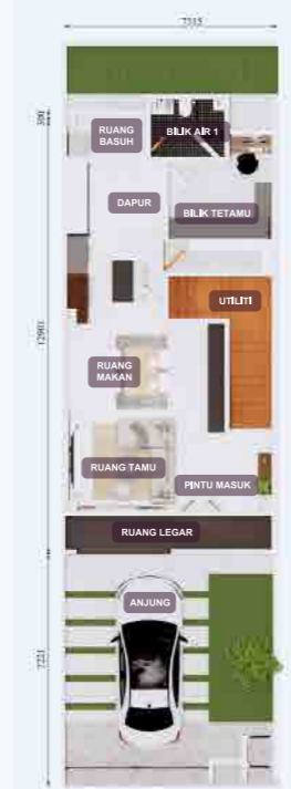
PELAN LANTAI TINGKAT BAWAH