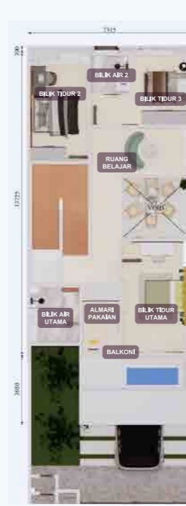
PELAN LANTAI TINGKAT ATAS