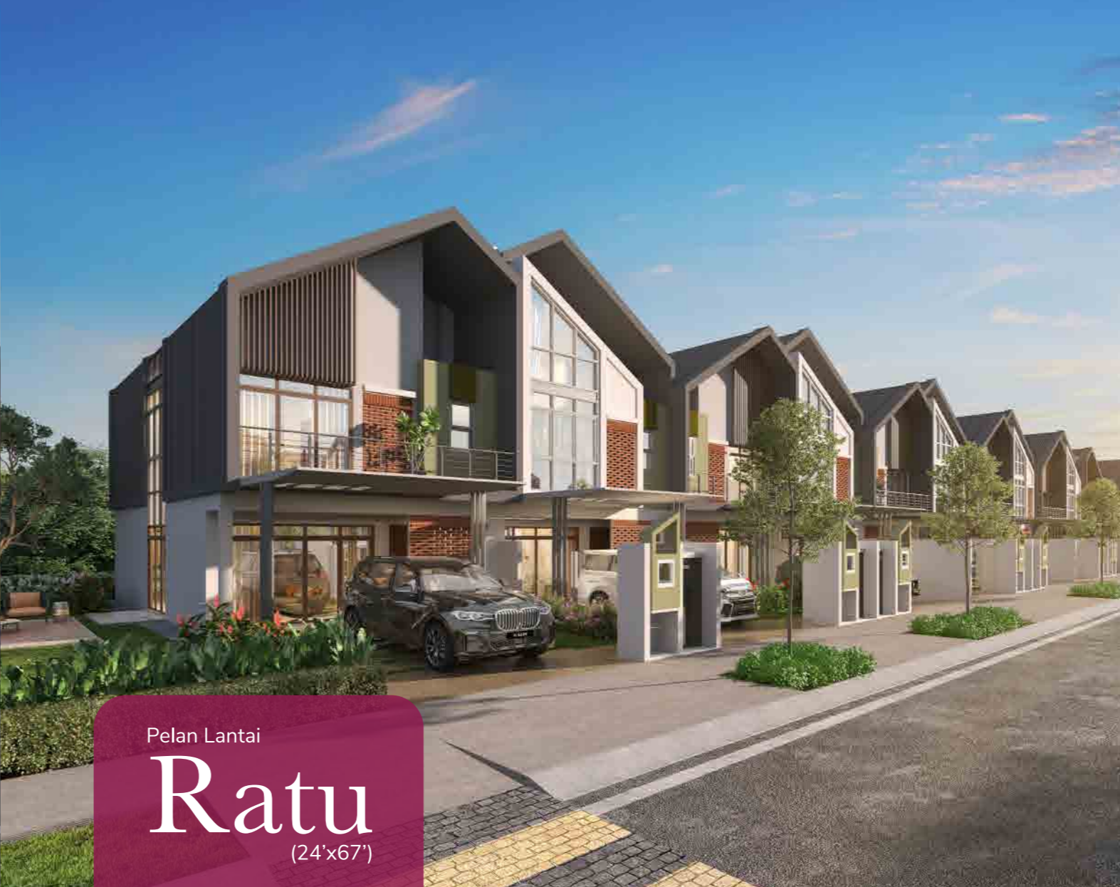
Pelan Lantai Ratu (24'x67')