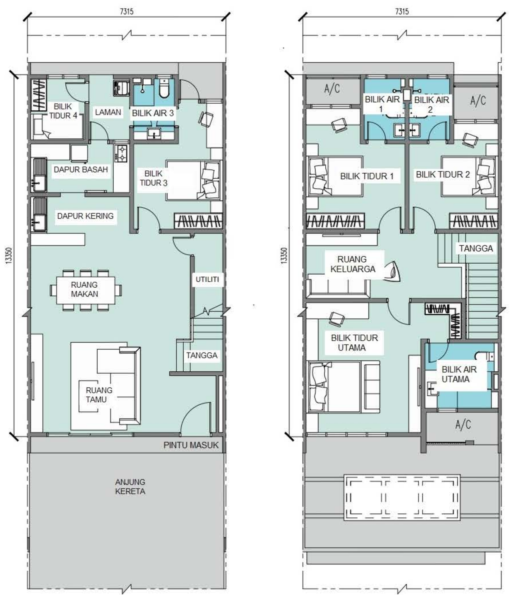
PELAN LANTAI TINGKAT BAWAH | PELAN LANTAI TINGKAT ATAS