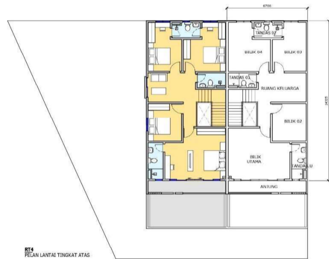
Pelan Lantai Tipikal

AKITEK : ALM ARCHITECTS NO. 1-04-31, E-GATE, LEBUH TUNKU KUDIN 2 11700 GELUGOR PULAU PINANG JURUTERA : WK CONSULTANT 5-5-8, HUNZA COMPLEX. JALAN GANGSA 11600 GEORGETOWN, PENANG JURUKUR : JURUUKUR SELATAN NO. 31A, LENGKOK RISHAH 2 PUSAT PERNIAGAAN RISHAH 30100 IPOH, PERAK