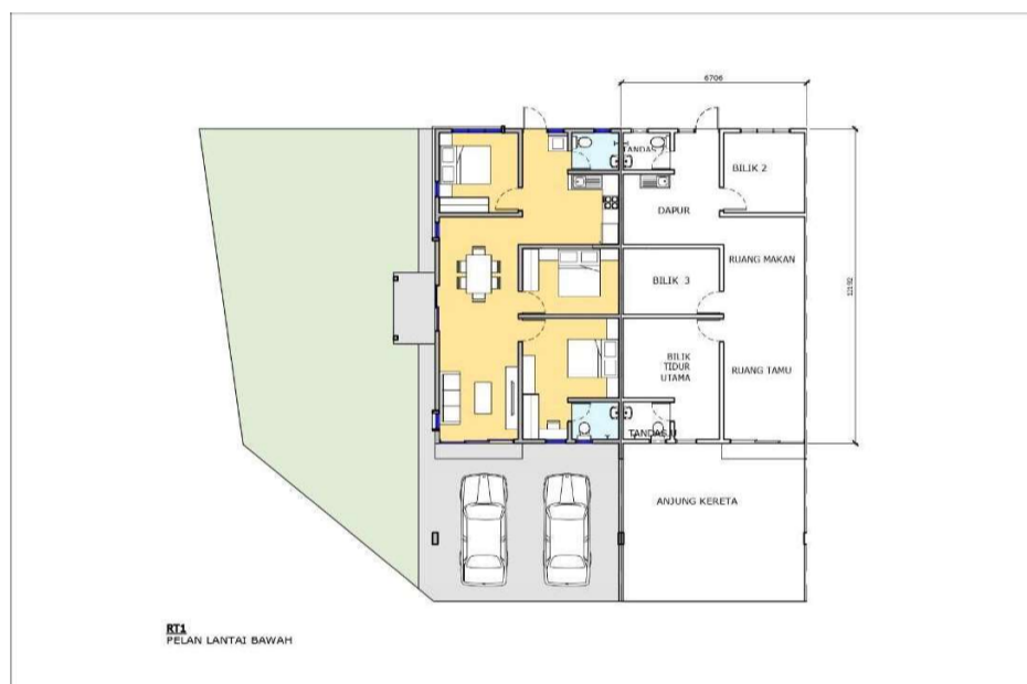
Pelan Lantai Tipikal

AKITEK : ALM ARCHITECTS NO. 1-04-31, E-GATE, LEBUH TUNKU KUDIN 2 11700 GELUGOR PULAU PINANG