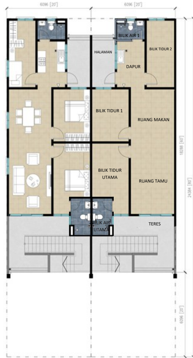
Pelan Tingkat Satu