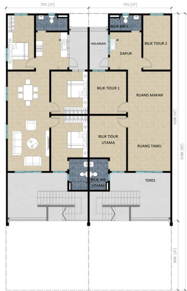
Pelan Tingkat Satu