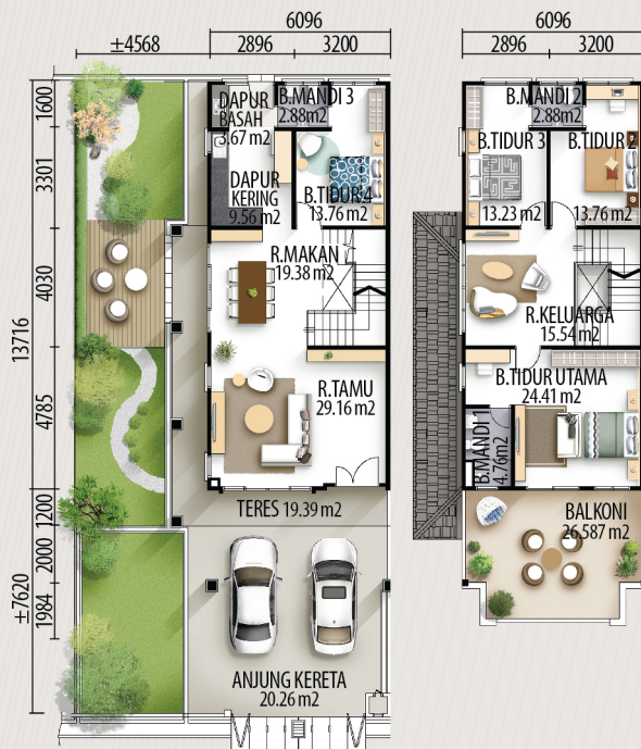
RUMAH TERES 2-TINGKAT JENIS B - 9 UNIT

Keluasan Tanah : 22' x 70' Keluasan Binaan : 22' x 45'