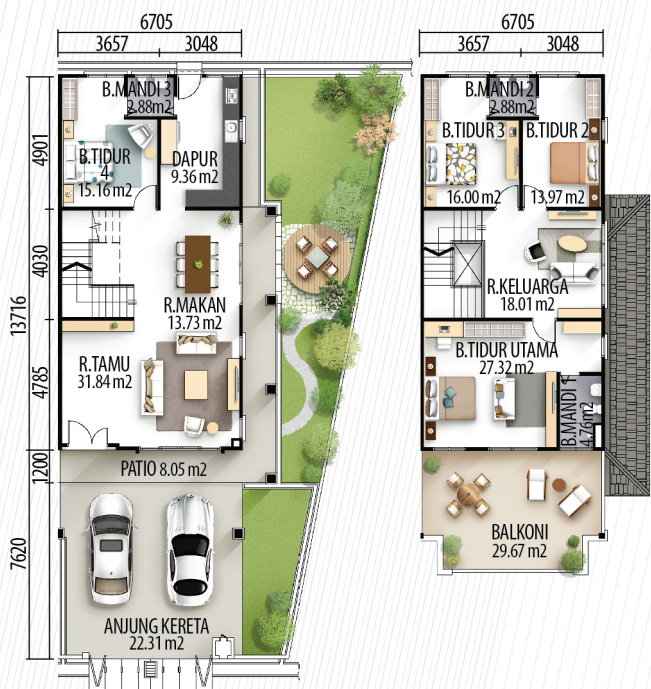
RUMAH TERES 2-TINGKAT JENIS A - 3 UNIT

Keluasan Tanah : 22' x 70' Keluasan Binaan : 22' x 45'