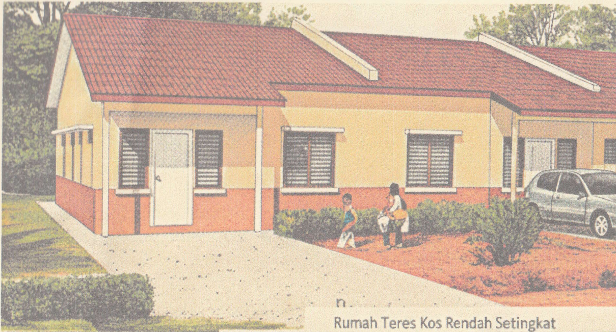
Rumah Teres Kos Rendah Setingkat

IKLAN INI TELAH DILULUSKAN OLEH JABATAN PERUMAHAN NEGARA. MAKLUMAT PEMAJU DAN IKLAN YANG DILULUSKAN BOLEH DISEMAK DI PORTAL TEDUH KPKT.GOV.MY