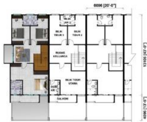
Pelan Tingkat Atas