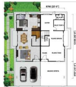
Pelan Tingkat Bawah