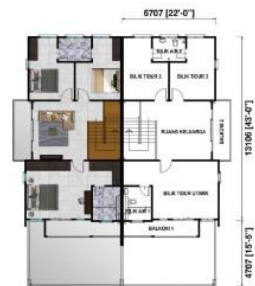
Pelan Tingkat Atas