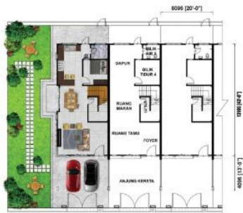
Pelan Tingkat Bawah