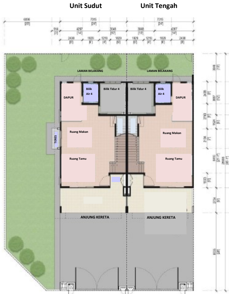
Pelan Tingkat Bawah