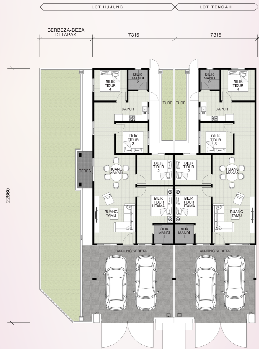
Pelan Tingkat Bawah