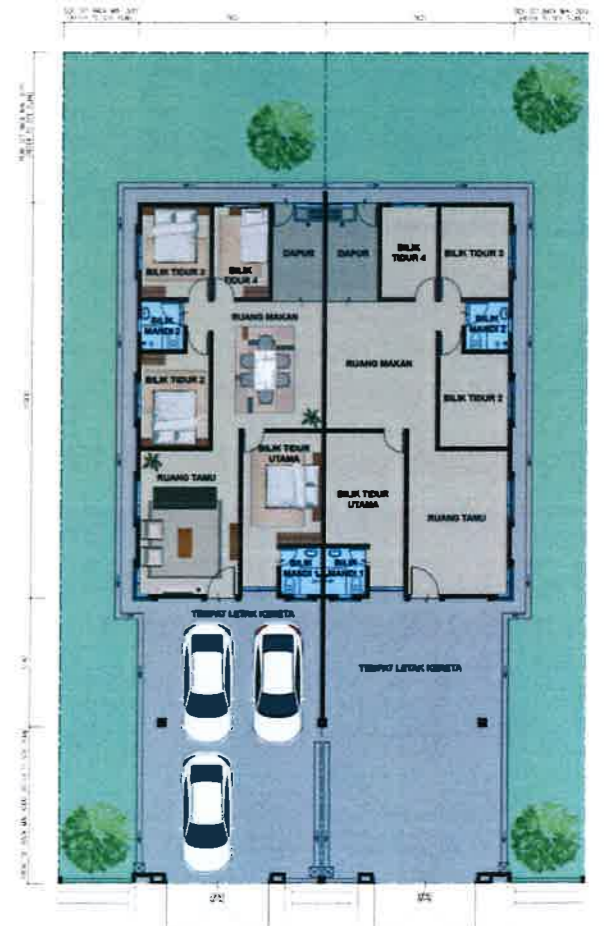
PELAN LANTAI RUMAH BERKEMBAR 1 TINGKAT