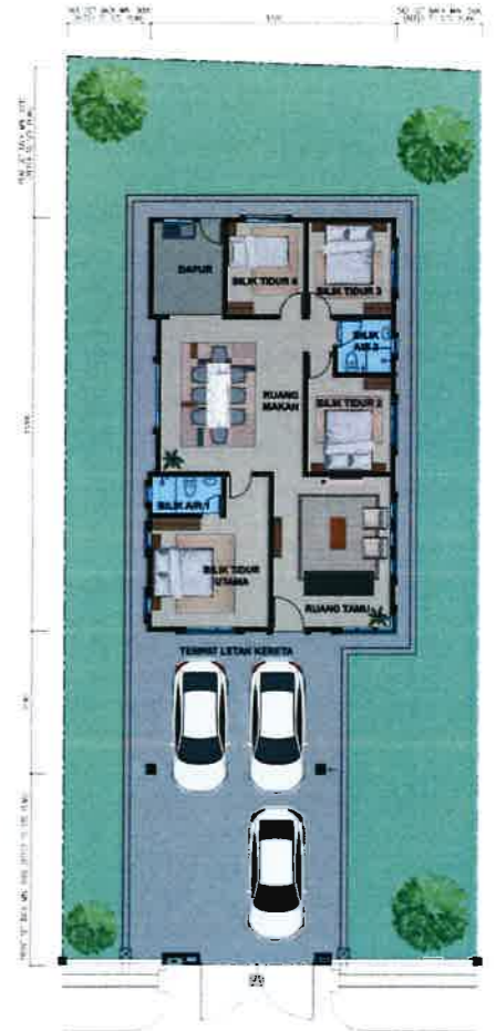
PELAN LANTAI RUMAH SESEBUAH 1 TINGKAT