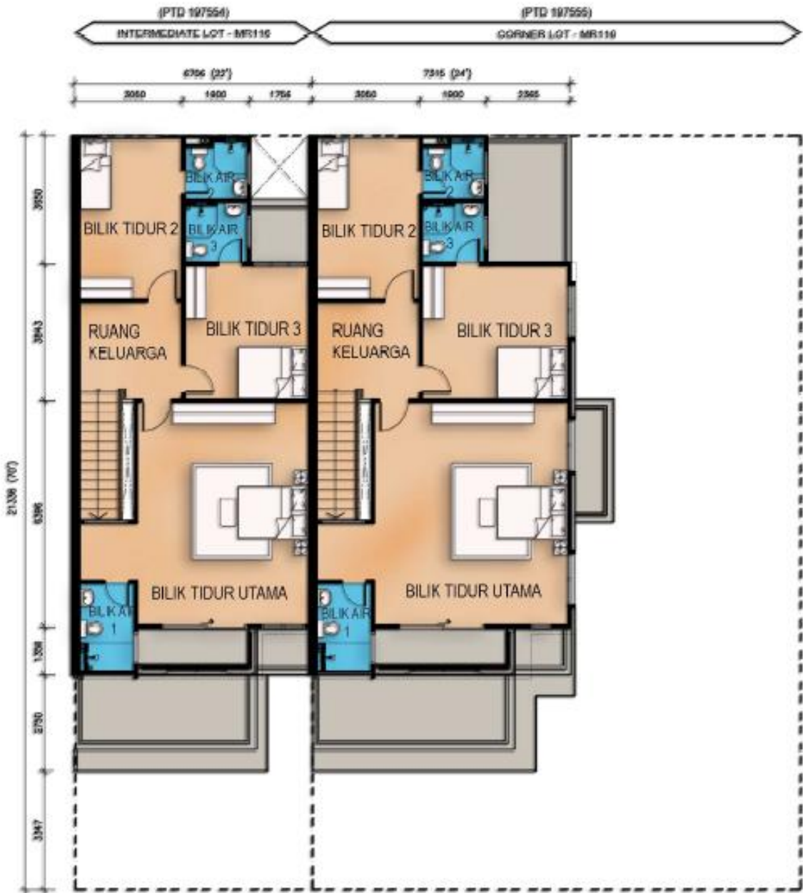
Jenis MR116 Tingkat Atas Rumah Teres Dua Tingkat