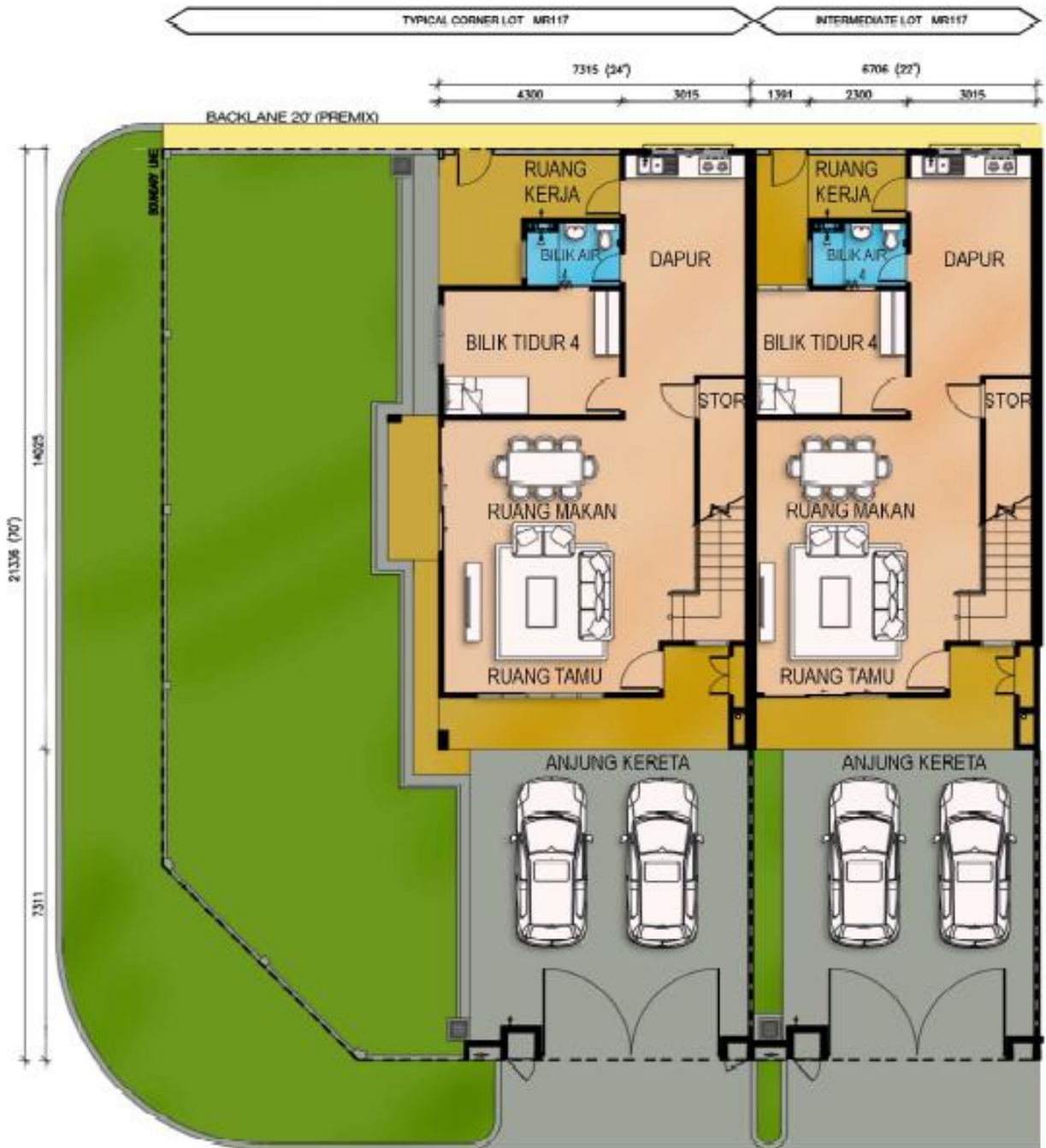
Jenis MR117 Tingkat Bawah Rumah Teres Dua Tingkat