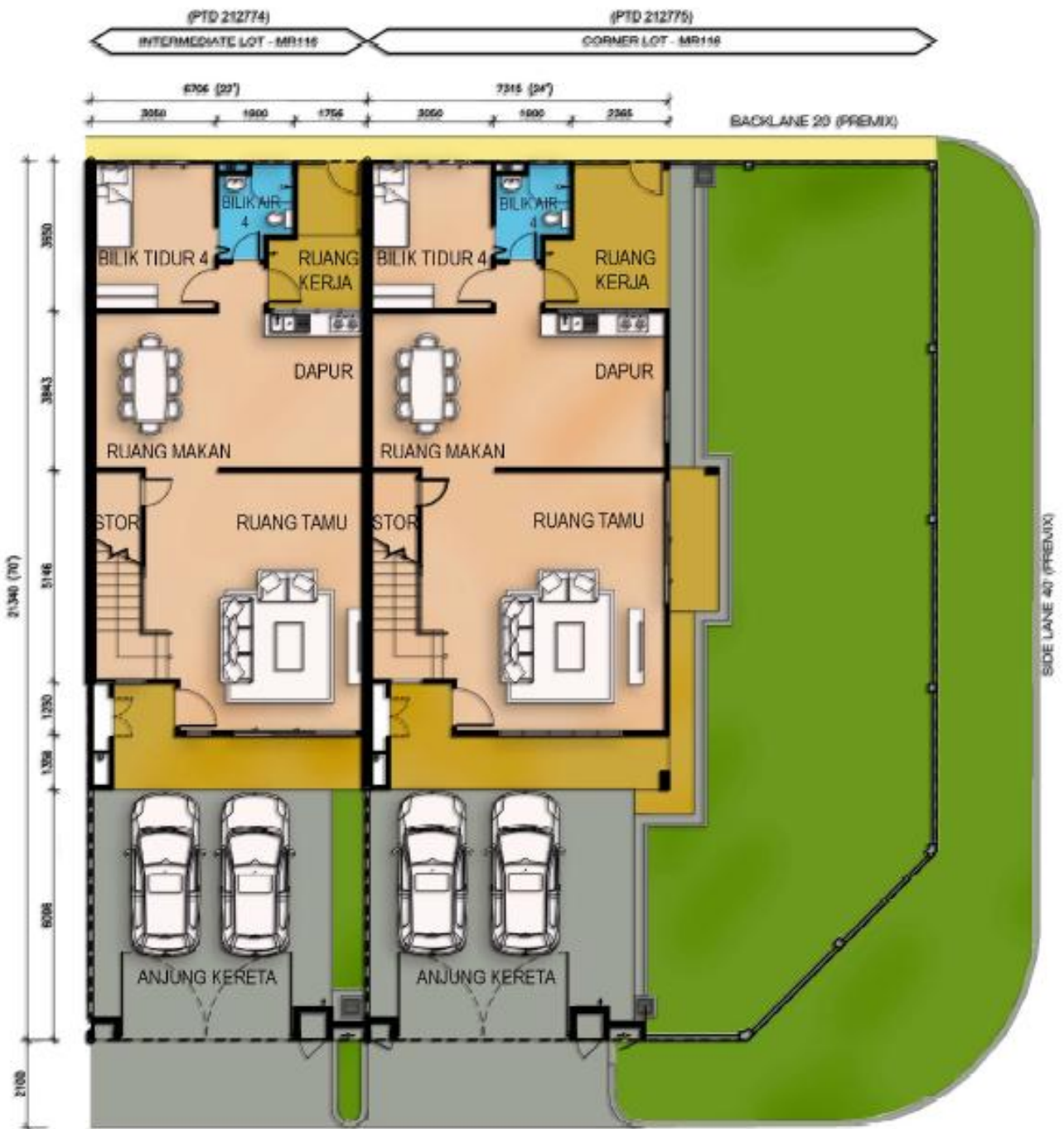
Jenis MR116 Tingkat Bawah Rumah Teres Dua Tingkat