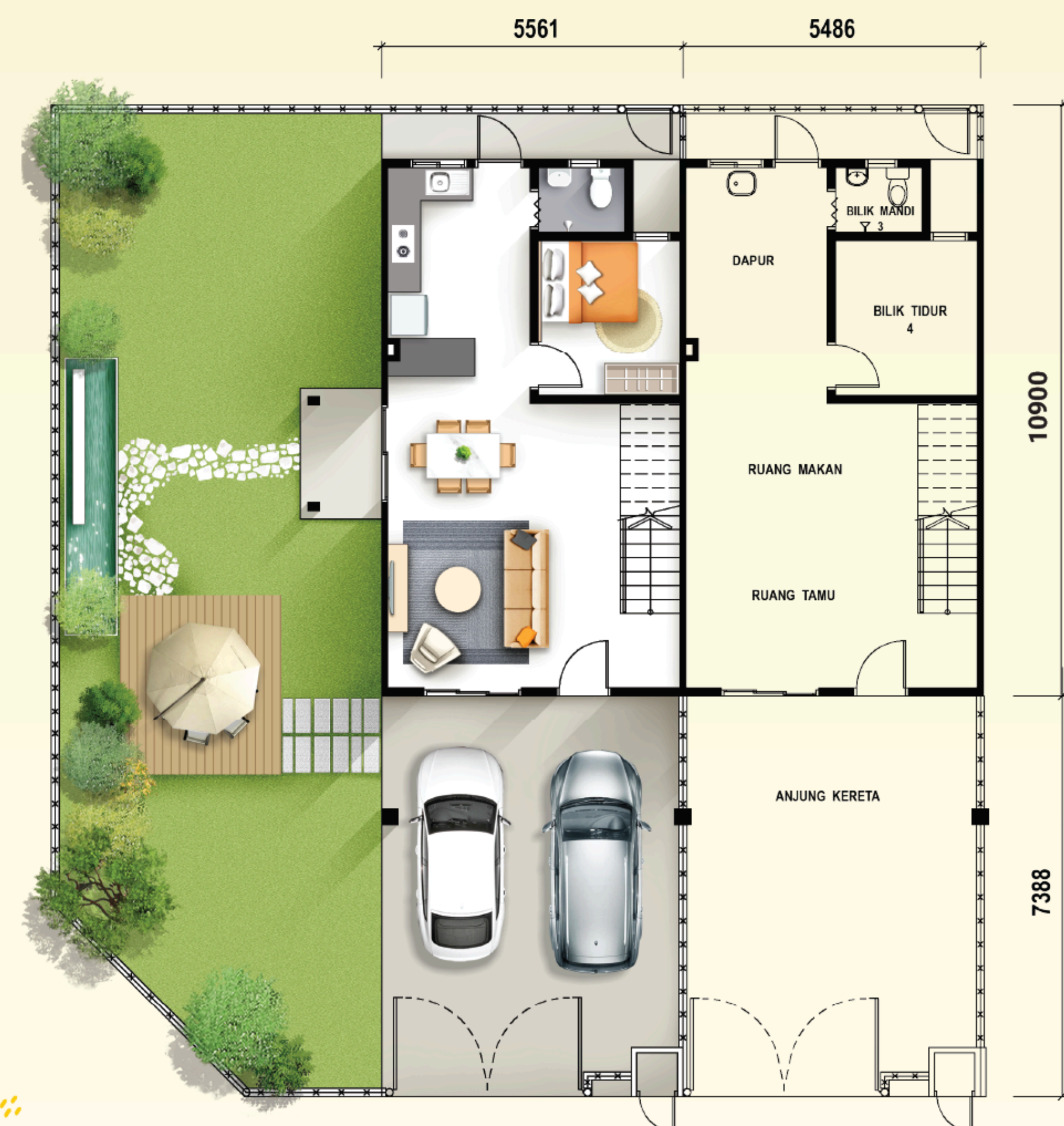
TINGKAT BAWAH RUMAH TERES 2 TINGKAT