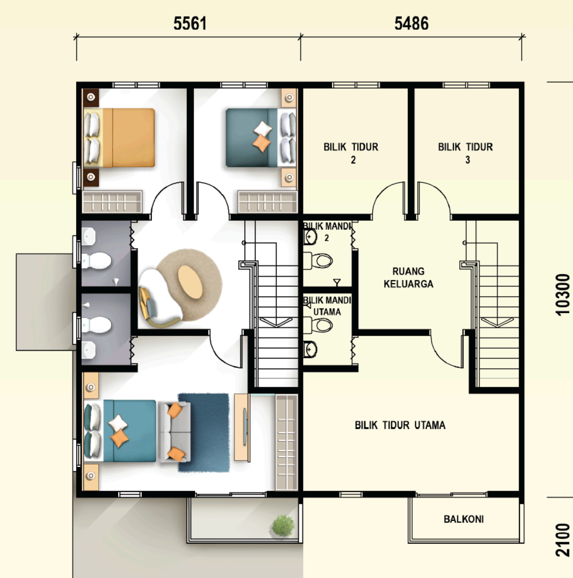
TINGKAT ATAS RUMAH TERES 2 TINGKAT