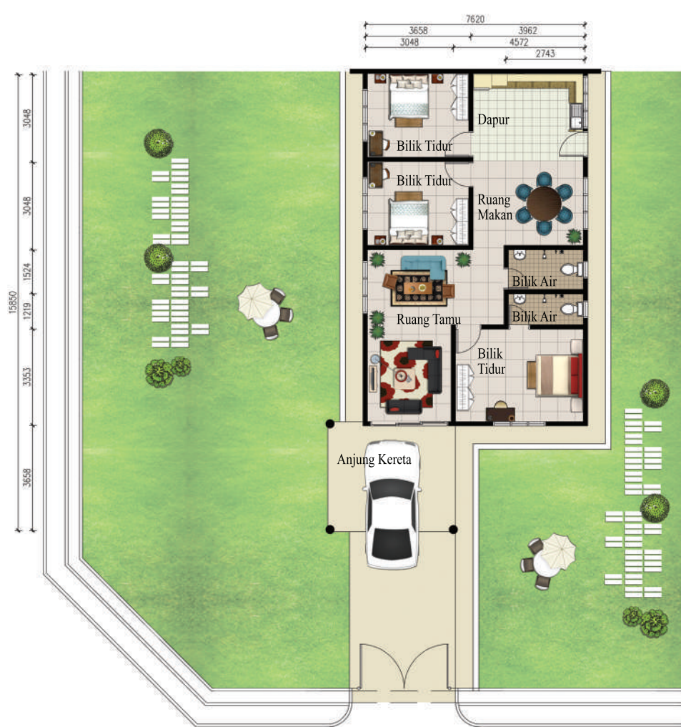
Pelan Lantai Rumah Berkembar Setingkat 1 Jenis B