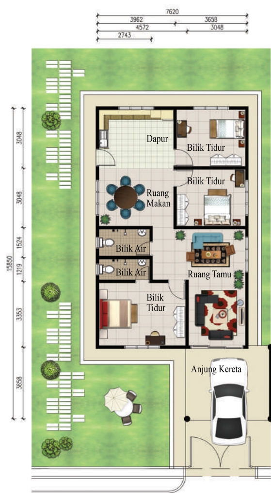
Pelan Lantai Rumah Berkembar Setingkat 1 Jenis A