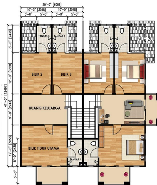
Tingkat Satu 740 Kaki Persegi