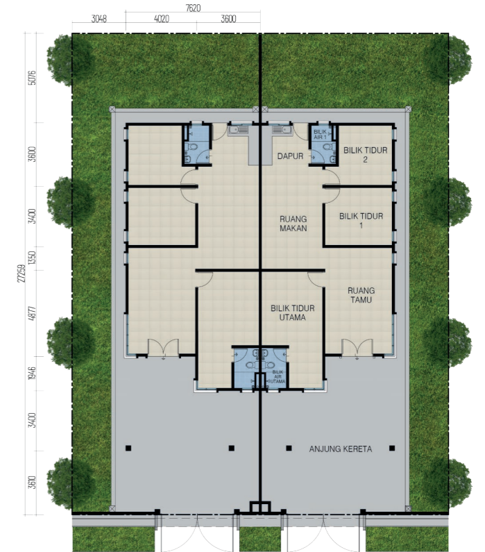
PELAN LANTAI RUMAH BERKEMBAR 1 TINGKAT