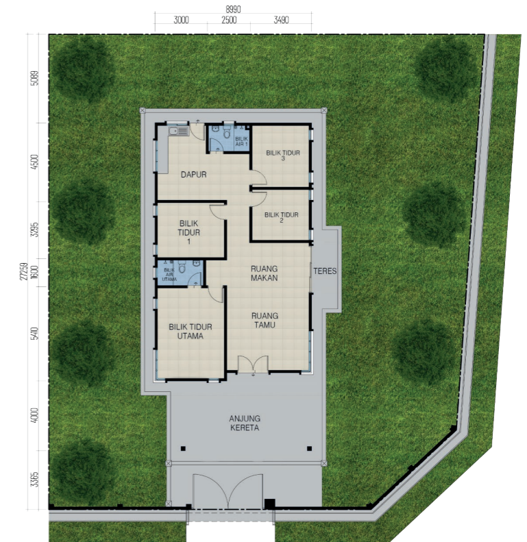
PELAN LANTAI RUMAH SESEBUAH 1 TINGKAT