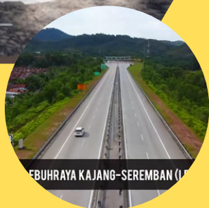
LEBUHRAYA KAJANG-SEREMBAN (L)

Keluasan Binaan 1,032KP - 1,430KP 3 Bilik 2 Bilik Air