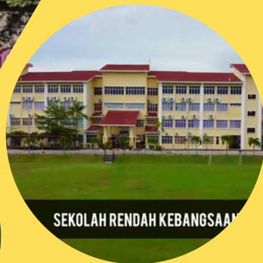
SEKOLAH RENDAH KEBANGSAAN

Keluasan Binaan 1,032KP - 1,430KP 3 Bilik 2 Bilik Air