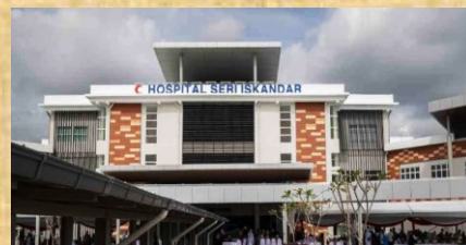
(Semua kemudahan di dalam radius 10km – 20km)