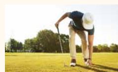
Horizon Hills Golf Club