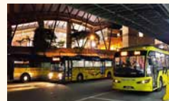
CIQ Second Link