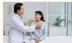
Gleneagles Medini Hospital