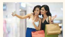
Aeon Mall Bukit Indah