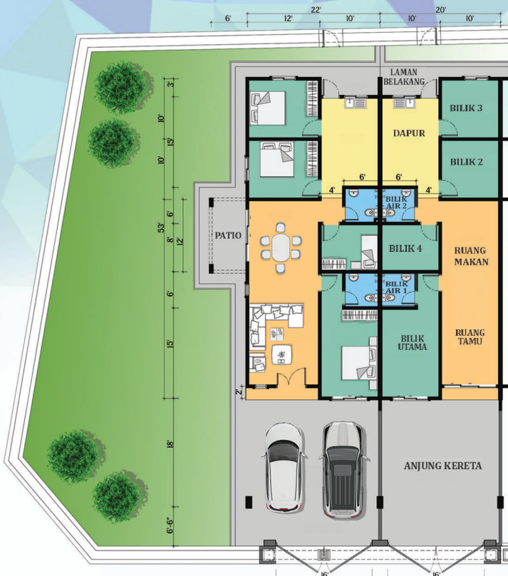
PELAN LANTAI JENIS A Saiz Rumah 20'-22' X 53'