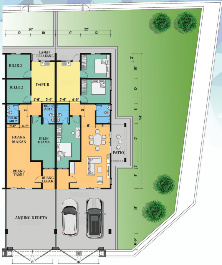
PELAN LANTAI JENIS B Saiz Rumah 20'-22' X 54'