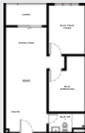
SOHO JENIS A ( 600 sqft )