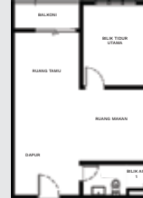
JENIS B ( 550 sqft )