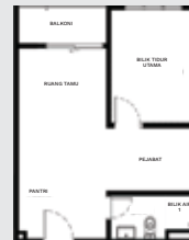
SOHO JENIS B ( 450 sqft )

Pemaju : ARMANI KPF2 DEVELOPMENT SDN. BHD. (1389764-P) Level 17, Subplace Boulevard, Pusat Komersil Vestland, No 6, Jalan Juruanalisis U1/35, Seksyen U1, 40150 Shah Alam, Selangor.