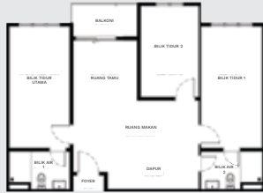
JENIS A ( 936 sqft )