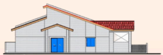
PANDANGAN SISI KIRI