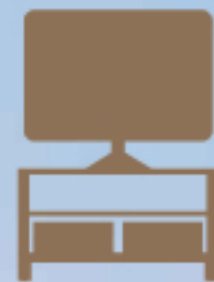
Kabinet TV Dan TV