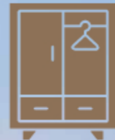
3 Almari Pakaian