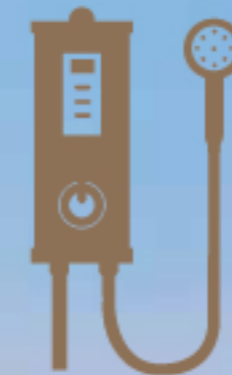
2 Pemanas Air