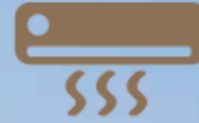
3 Penghawa Dingin