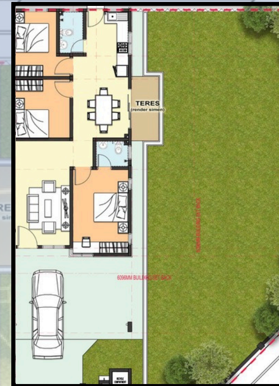
ANJUNG KERETA (render simen)