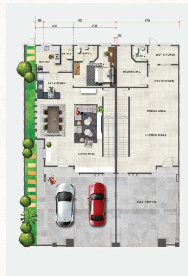
PELAN TINGKAT BAWAH