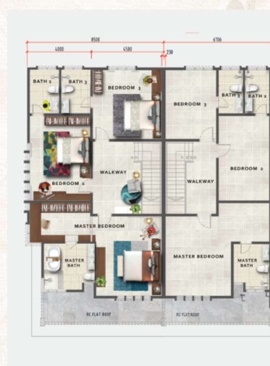
PELAN TINGKAT ATAS

30* Unit Sahaja 2 Tingkat Teres 4 Bilik Tidur 4 Bilik Mandi