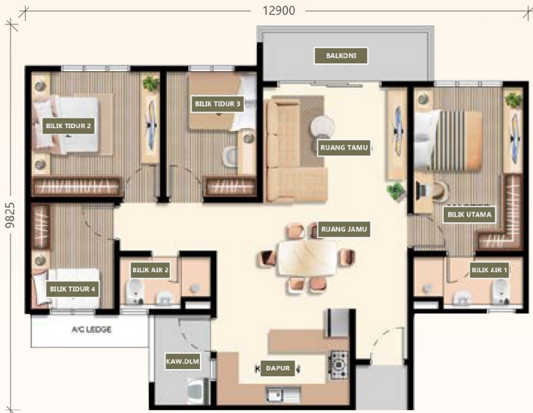
Jenis B LUAS BINAAN : 1,093.25 SQ.FT. Bilik Tidur : 4 Bilik Air : 2

Residensi D'Nova menawarkan pengalaman hidup yang holistik. Nikmati suasana tenang di rumah anda, di mana setiap butiran direka dengan teliti untuk meningkatkan kehidupan harian anda. Memaksimumkan cahaya semula jadi dari tingkap sehingga rekaan ruang bahagian dalam rumah bagi memastikan keselesaan dan kemudahan anda.