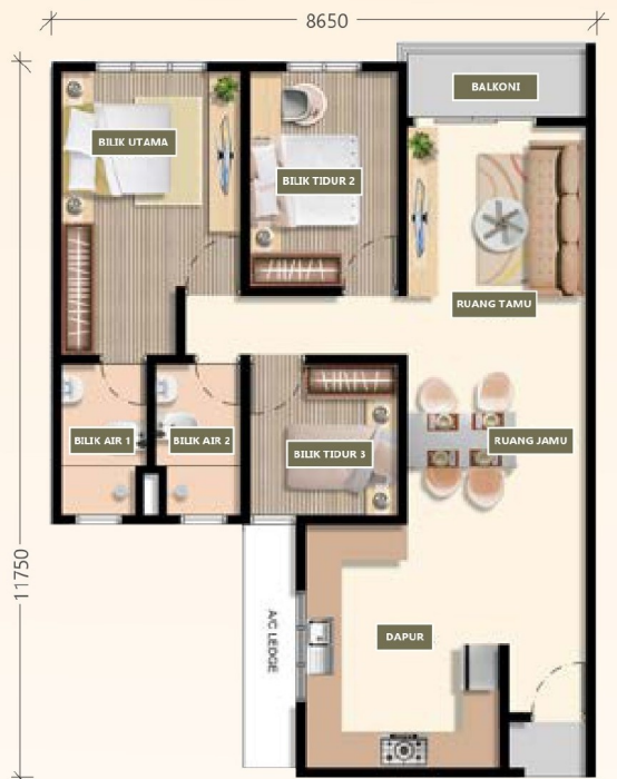
Jenis C2 LUAS BINAAN : 901.61 KPS Bilik Tidur : 3 Bilik Air : 2