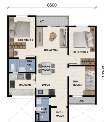
BLOK C 730 / 800 kaki persegi