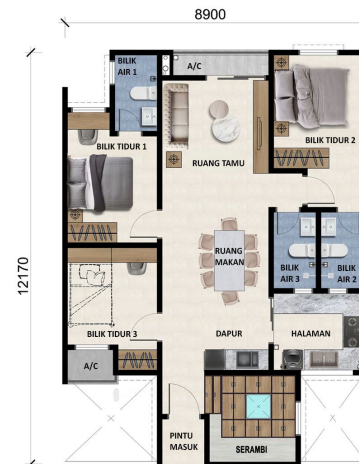
BLOK A & B 1005 kaki persegi