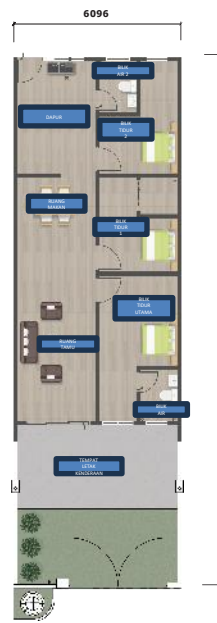
RUMAH TERES PERANTARAAN SETINGKAT 3 BILIK TIDUR + 2 BILIK MANDI SAIZ LOT: 20 X 65'