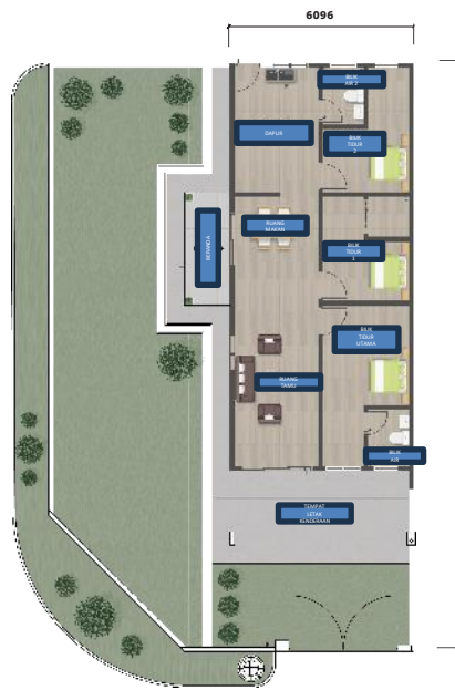
RUMAH TERES SUDUT SETINGKAT 3 BILIK TIDUR + 2 BILIK MANDI SAIZ LOT: 20 X 65'