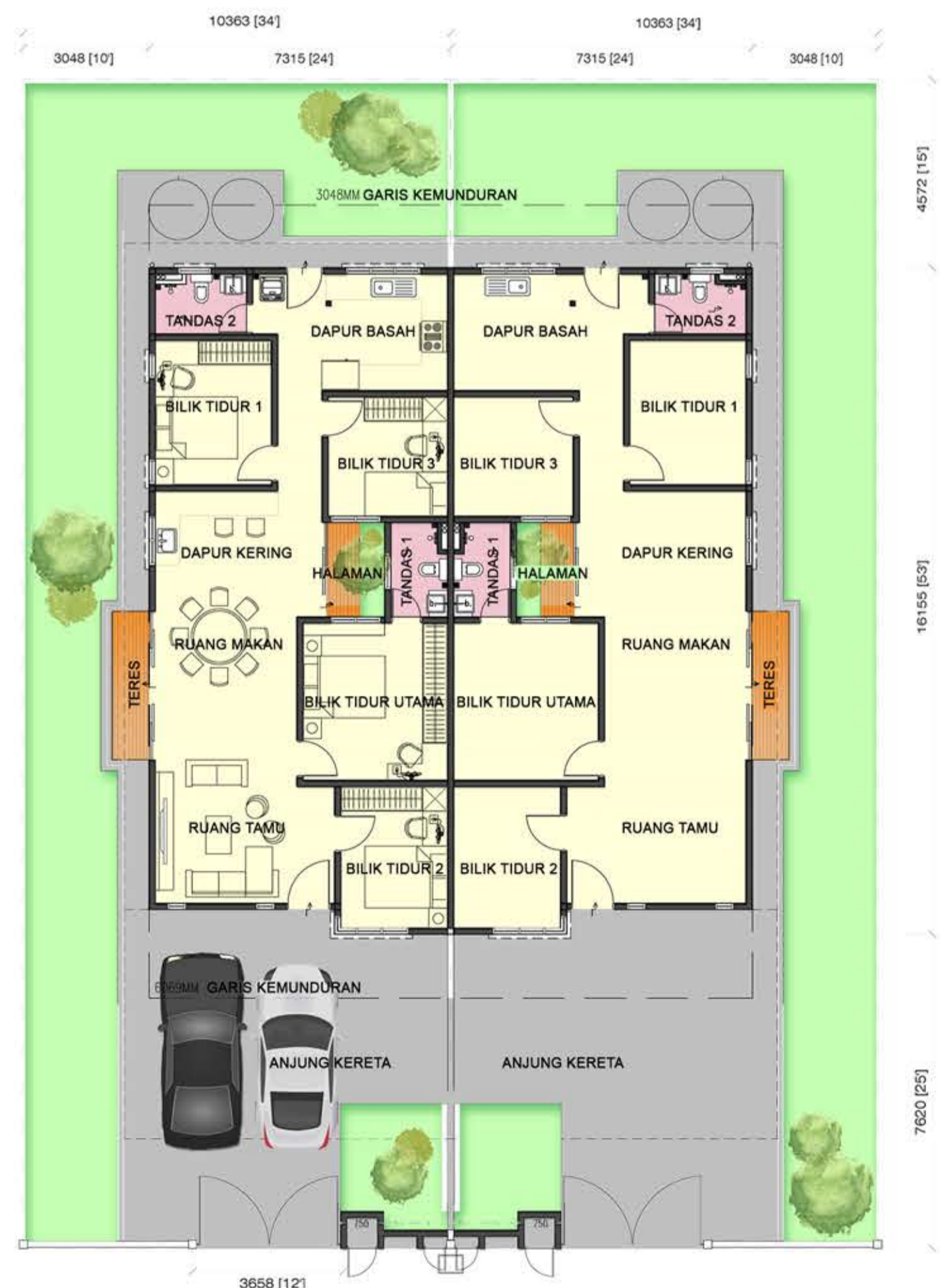
PELAN LANTAI TIPIKAL RUMAH BERKEMBAR 1 TINGKAT (24' X 53') - 28 UNIT SAIZ TANAH : 34.2' - 34.5' (LEBAR) X 93' (PANJANG) LUAS BINAAN : 1.272 KAKI PER SEGI