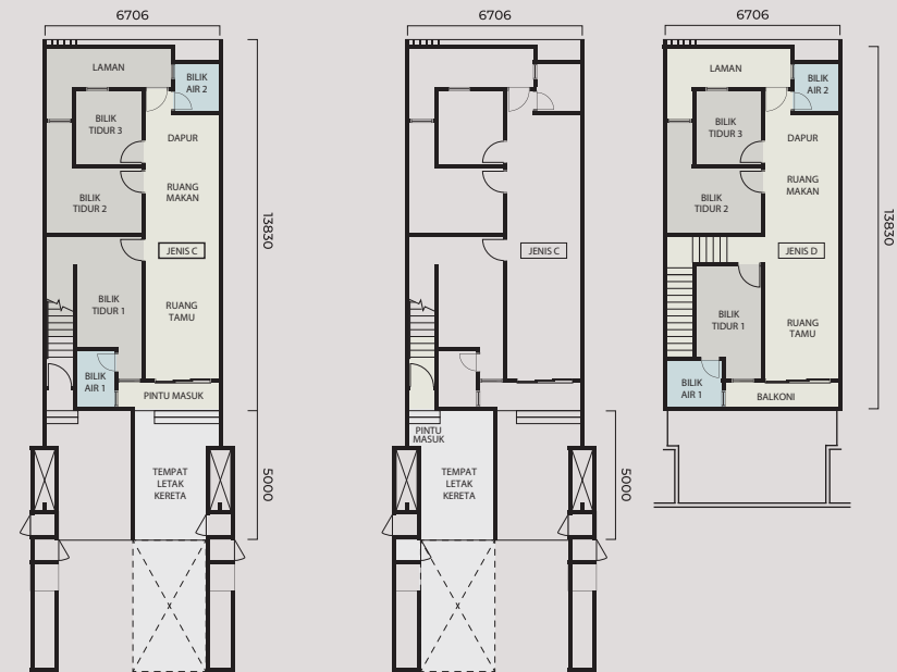
Jenis C 1,115 k.p.s. | 3 Bilik Tidur, 2 Bilik Air