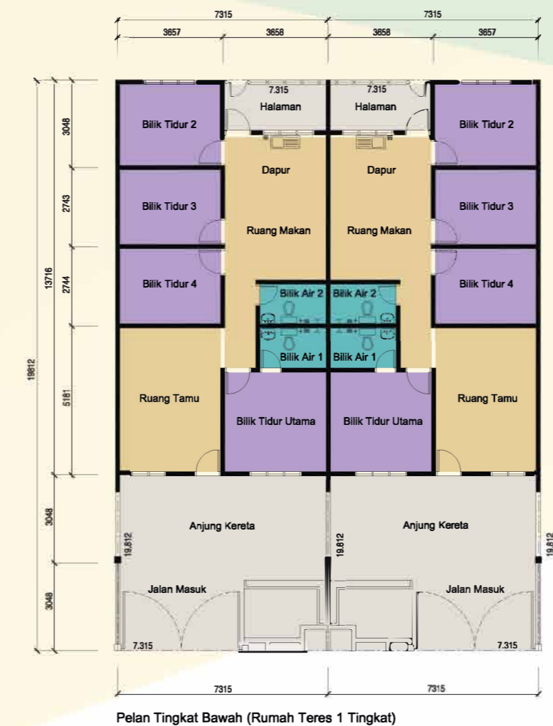
Pelan Tingkat Bawah (Rumah Teres 1 Tingkat)