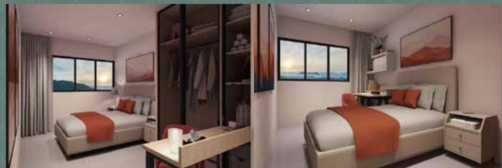
▲ Bilik tidur utama