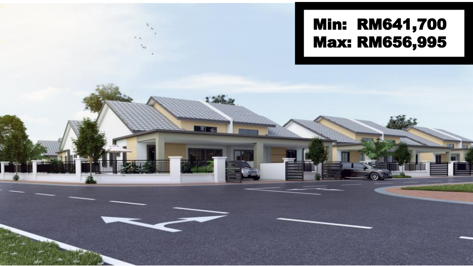
Rumah Kluster 1 Tingkat Jenis A – 40 Unit Zone B Fasa VI