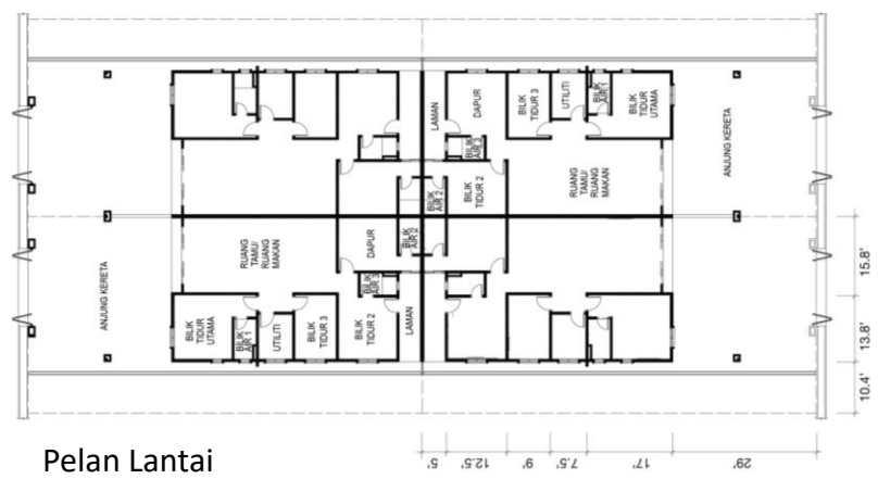
Pelan Lantai Rumah Kluster 1 Tingkat (Jenis A)