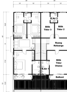
Pelan Lantai Tingkat Atas