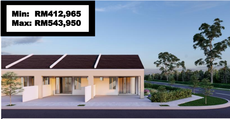
Rumah Teres 1 Tingkat Fasa 2A – 64 unit