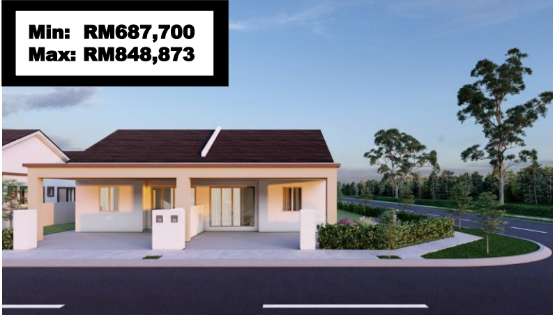
Rumah Berkembar 1 Tingkat Fasa 2A – 10 unit