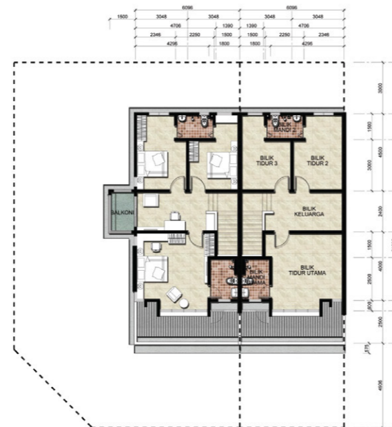
Pelan Aras Satu