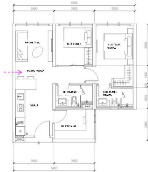
Jenis A (2+1 bilik tidur dan 2 bilik mandi) 704 kaki persegi