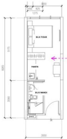
Jenis B (1 bilik tidur dan 1 bilik mandi) 267 kaki persegi