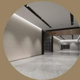
Lobi Penerimaan Tetamu