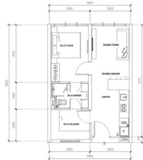
Jenis C (1+1 bilik tidur dan 1 bilik mandi) 516 kaki persegi

No. Lesen Pemajuan Perumahan : 20258/05-2029/0233(R)