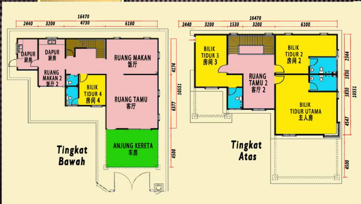
1 UNIT RUMAH BUNGALOW DUA TINGKAT RM 800,000.00

No. Lesen Pemaju: 20255/03-2027/0127(R) Tempoh Sah Lesen: 18/03/2027