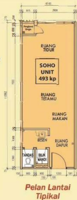
Pelan Lantai Tipikal