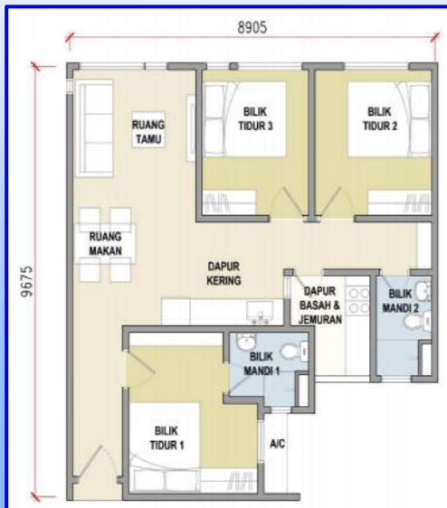
JENIS A1 (828 kps)