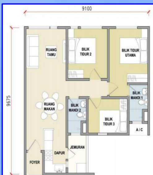
JENIS C (818 kps)