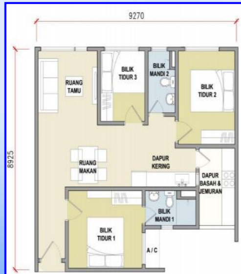
JENIS B (818 kps)