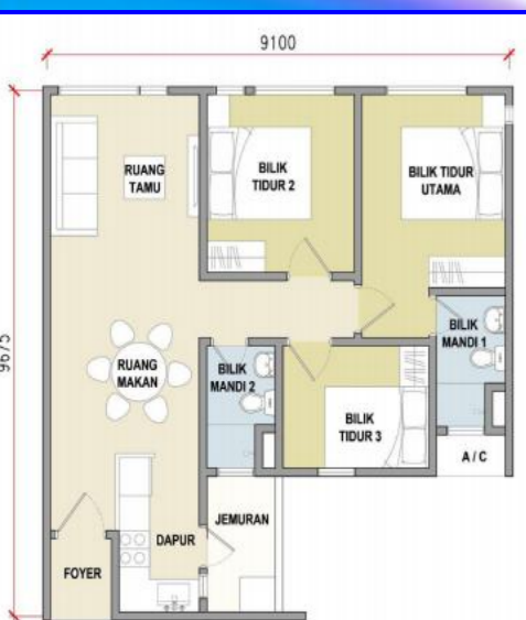
JENIS C2 (818 kps)