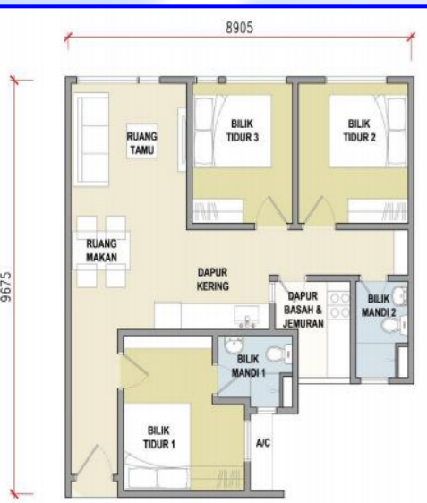
JENIS A (828 kps)