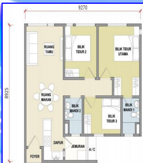
JENIS C3 (818 kps)