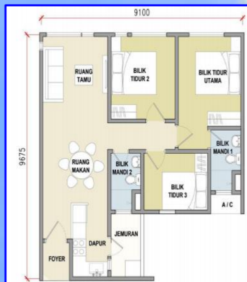
JENIS C1 (818 kps)