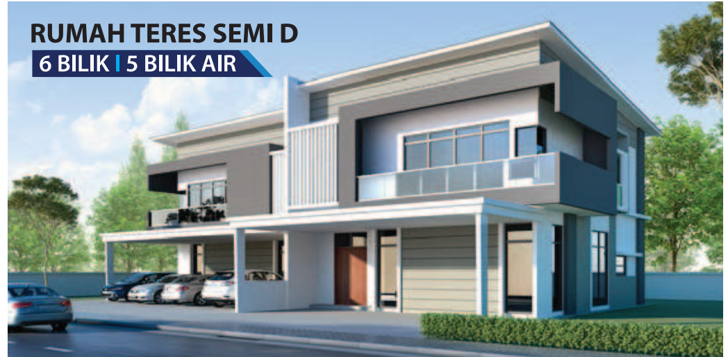
RUMAH TERES SEMI D 6 BILIK | 5 BILIK AIR