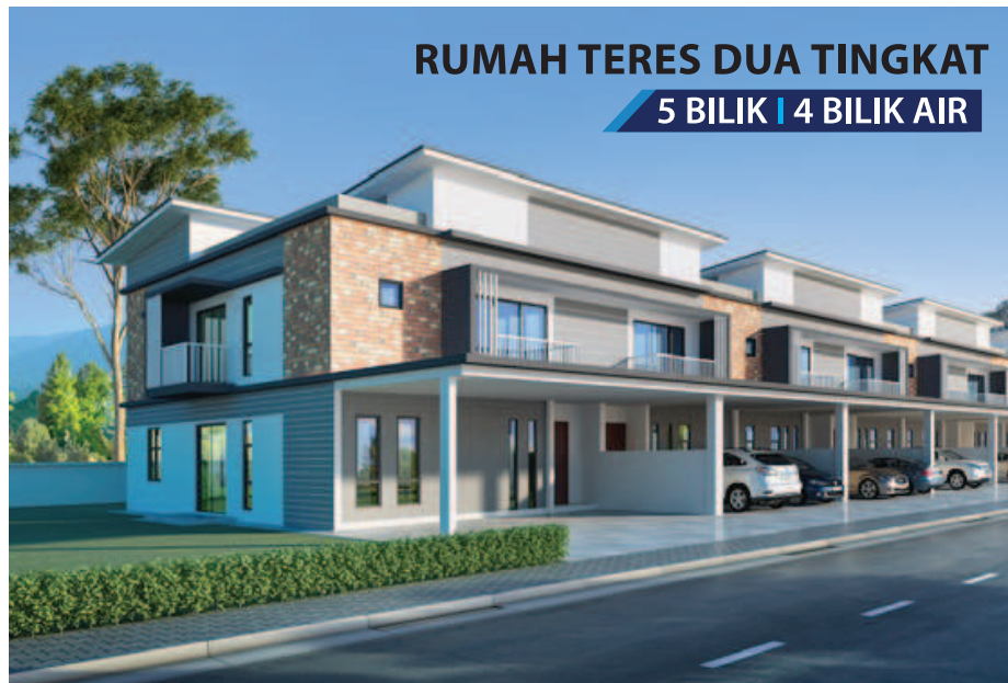
RUMAH TERES DUA TINGKAT 5 BILIK | 4 BILIK AIR