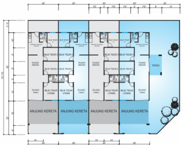
Jenis A:- 1 unit 20' x 70'/75'