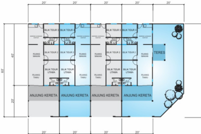
Jenis C:- 8 unit 20' x 60'