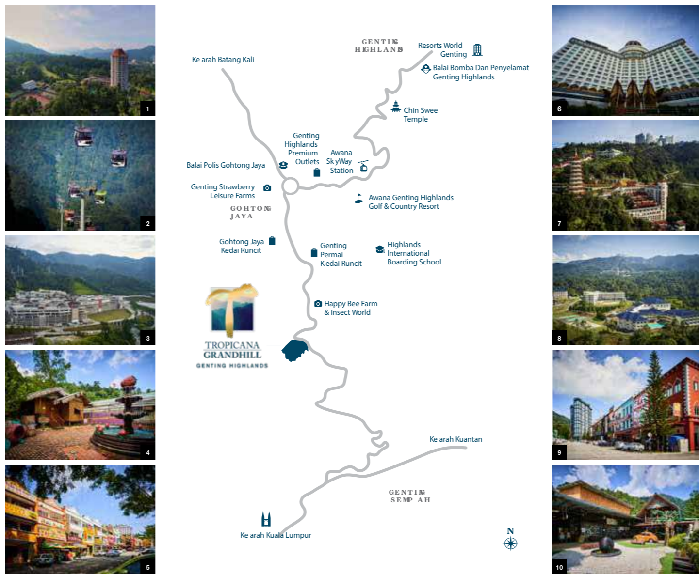
1 Awana Genting Highlands Golf & Country Resort 2 Awana SkyWay Station 3 Genting Highlands Premium O outlets 4 Genting Strawberry Leisure Farms 5 Gohtong Jaya Kedai Runcit 6 Resorts World Genting 7 Chin Swee Temple 8 Highlands International Boarding School 9 Genting Permai Kedai Runcit 10 Happy Bee Farm & Insect World

Terletak 13km dari Bandar Genting Highlands yang strategik, Tropicana Grandhill dilengkapi dengan kemudahan harian yang moden seperti sekolah antarabangsa, destinasi berbudaya dan pusat membeli-belah.